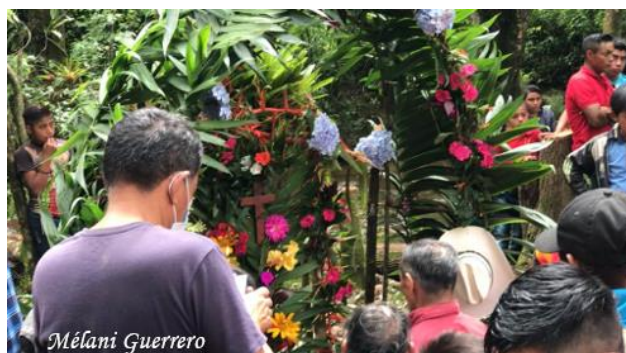
Compostura del agua para creación de pequeña hidroeléctrica comunitaria, Plan de Barrios