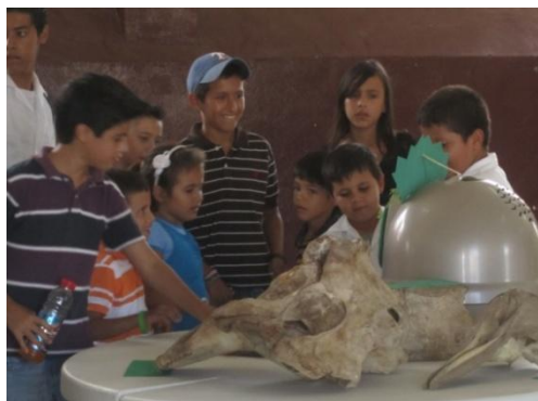
Un grupo de niños disfrutaban conociendo las especies que el Museo Móvil de Historia Natural de la UNAH exhibió en el Municipio de Colinas

Con el propósito de ampliar el ámbito de influencia del Museo de Historia Natural de la UNAH se ha preparado el proyecto de creación del Museo Itinerante de Historia Natural, en parte porque las visitas que recibe han ido disminuyendo debido a problemas de transporte y dificultades por la inseguridad, entre otros. El proyecto consiste en realizar exhibiciones desmontables, prácticas educativas y de fácil transporte, para trasladarse a centros educativos de áreas aledañas a los municipios vecinos que por dificultades económicas no pueden visitar el museo en la UNAH. Con este proyecto se espera atender una importante cantidad de población estudiantil de diferentes niveles, contando con el apoyo de los estudiantes de la carrera de Biología y las autoridades municipales. A la fecha el proyecto ha realizado su primera gira al Municipio de San José de Colinas, presentado la muestra del Museo Móvil de Historia Natural, y con el apoyo de dos docentes y 4 estudiantes, quienes permanecieron