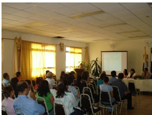
Los asistentes al evento de presentación del estudio Evaluación de Cobertura de Servicios de Prevención del VIH en Adolescentes y Jóvenes

La Dirección de Vinculación Universidad-Sociedad participó en el IV Congreso de Investigación Científica, que se celebró del 9 al 12 de agosto 2010, en Ciudad Universitaria. En esta ocasión se presentó la versión final del Estudio Evaluación de Cobertura de Servicios de Prevención del VIH en Adolescentes y Jóvenes de Tegucigalpa, M.D.C., Honduras C.A. realizado por docentes de las unidades académicas de Trabajo Social, Psicología, Unidad de Investigación Científica y la DVUS, con el apoyo de de la OPS/OMS. Las conclusiones principales del estudio apuntan a fortalecer la estrategia de vinculación de las acciones específicas de promoción de la prevención a través de la abstinencia, la postergación y el uso del condón en la población joven, enfatizando la toma de conciencia sobre el riesgo de tener relaciones sexuales con múltiples parejas. Asimismo se recomienda implementar un sistema de registro sobre la atención brindada por la Secretaría de Salud a jóvenes de 15-24 años y fortalecer los programas de vinculación de los Centros de Salud con las comunidades. Se contó con la