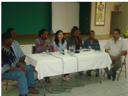
Representantes de ODECO y la UNAH durante la conferencia de prensa celebrada en el Centro Satuye de ODECO, La Ceiba.

Para la Organización ODECO la vinculación con la Academia significa un respaldo importante a todas las acciones que han venido realizando desde su fundación en 1992 en pro del desarrollo integral de las comunidades Afrohondureñas.