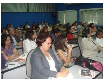
Asistentes al lanzamiento del Diplomado en Violencia y Trata de Personas

En el marco del Convenio “Fortalecimiento de las capacidades de las instancias gubernamentales y de la sociedad civil para la protección integral de la niñez y la adolescencia con especial incidencia en trata de niños, niñas y adolescentes en Centroamérica” financiado por Agencia Española de Cooperación Internacional, Save The Children, Casa Alianza con la colaboración de la UNAH a través de la Dirección de Vinculación Universidad como coordinador y de las carreras de Psicología, Psiquiatría y Trabajo Social, implementan el Diplomado en Violencia y Trata con énfasis en niñez y adolescencia que brinda los conocimientos y herramientas metodológicas a personal de las diferentes instituciones gubernamentales y privadas sobre el abordaje de niñas, niños y adolescentes vulnerables o víctimas de la trata y delitos conexos. El Diplomado está dirigido a estudiantes universitarios y personal que trabaja directamente con la niñez y adolescencia en diferentes instituciones públicas y privadas del país y comprende un programa académico de 150 horas divididas en 6 módulos que incluyen un seminario de investigación y sistematización. El Diplomado inicia en su fase presencial a partir del 9 de octubre 2010, en el edificio de Ciencias Sociales de la Ciudad Universitaria, en el cual estarán participando 16 docentes, todos profesionales universitarios y/o investigadores relacionados con la temática del Diplomado y 35 estudiantes en su primera promoción. El