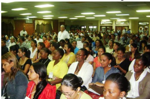
Egresados del CURLA durante la ceremonia de inauguración del Encuentro de Egresados 2010