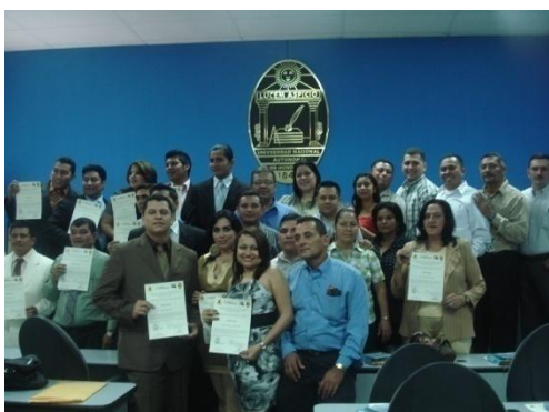
Los egresados provenientes de Choluteca y San Pedro Sula durante la ceremonia oficial de graduación.

Con el objetivo de establecer relaciones de cooperación y trabajo conjunto entre el Centro de Desarrollo Humano/Proyecto Cultivar y la UNAH, se desarrolló durante los meses de febrero a mayo la propuesta pedagógica con su presupuesto correspondiente del Diplomado en “Dialogo Social , Relaciones Laborales, Seguridad y Salud Ocupacional y Sistemas De Gestión” con el fin de desarrollar capacidades y preparar el recurso humano, para contribuir al mejoramiento de las