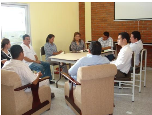
Miembros del Comité de Vinculación de CURC, CURLP y CURLA, reunidos con personal de la DVUS en el Centro Regional de Comayagua.