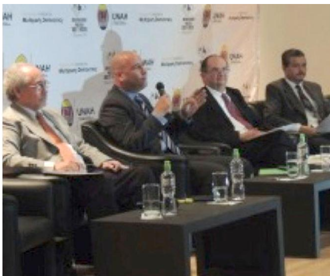
Con el propósito de fortalecer la cultura político-democrática de la sociedad hondureña y en el marco del Observatorio Político “Voz y Voto Honduras 2013” la Universidad Nacional Autónoma de Honduras, a través de la Dirección de Vinculación Universidad-Sociedad (DVUS), representantes del Comité de Vinculación del departamento de Sociología en conjunto al Instituto Holandés por la Democracia Multipartidaria (NIMD), realizaron en Ciudad Universitaria el foro “Los partidos políticos y los desafíos económicos del país: ¿qué soluciones ofrecen sus planes de gobierno?”