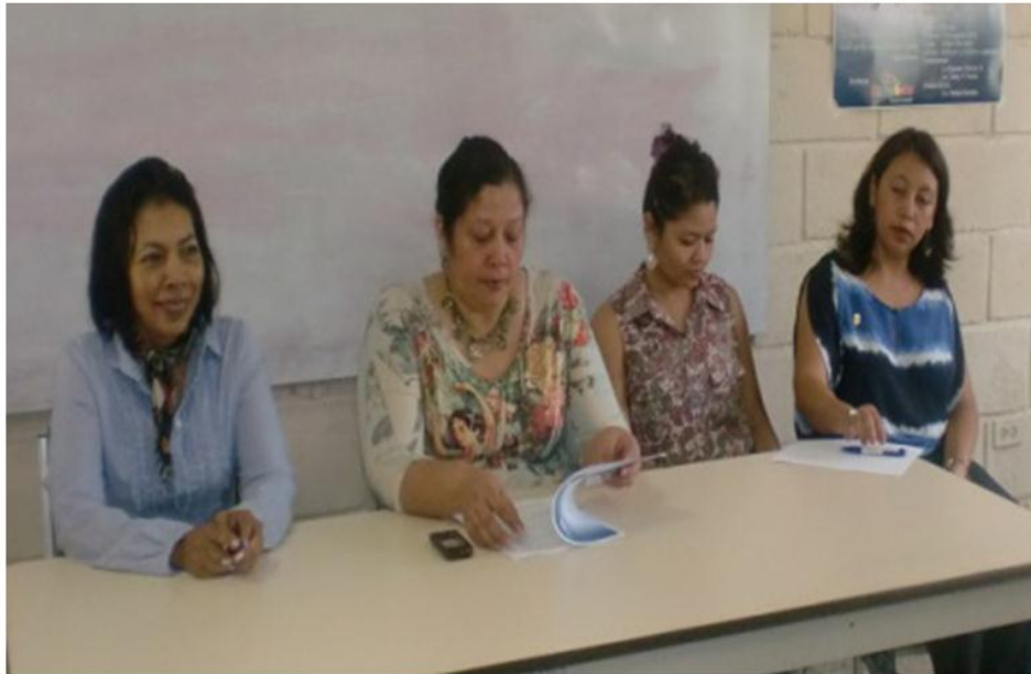
DVUS en UNAH-TEC/ Daní desarrolla taller de ortografía para periodistas de El Paraíso.