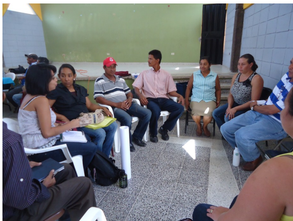
Estudiantes de de Trabajo Social impartiendo el taller de seguimiento a la elaboración del Plan de Desarrollo Municipal y Agenda de Competitividad Territorial (ACT) en Alcaldía Municipal de San Ignacio, Francisco Morazán. 2014.