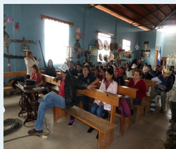
Presentación de la propuesta "fortalecimiento de las capacidades de la comunidad indígena de Yamaranguila".