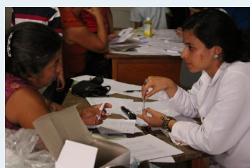
Estudiantes de Medicina al momento de levantar el diagnóstico de salud de los habitantes del Municipio.