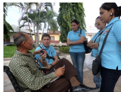
Imágenes de la visita de los estudiantes de la Escuela de Periodismo al municipio de San Ignacio y Cane.

Se cuenta con una propuesta de diseño de la clínica marterno-infantil, realizado por una estudiante de la Carrera de Arquitectura, para el municipio de Cane.