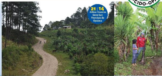
21/14 Aldea Caserío de San Francisco de Opalaca