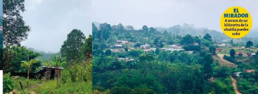
EL MIRADOR A menos de un kilómetro de la alcaldía puedes subir.