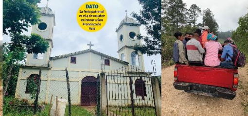
CREACIÓN San Francisco de Opalaca fue creado el día 1 de julio de 1964.