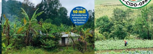
Más de 10 mil habitantes son el municipio de San Francisco de Opalaca

San Francisco de Opalaca es un municipio que se caracteriza por su gran diversidad cultural y étnica. Su territorio es el más grande del departamento de Intibucá, con una extensión de 229,43 kilómetros cuadrados. Su población es de 10,122 habitantes.