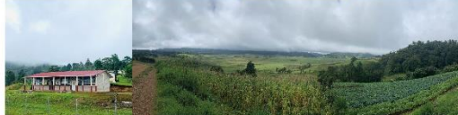
DATO La feria patronal en el día de octubre en honor a San Francisco de Asís.